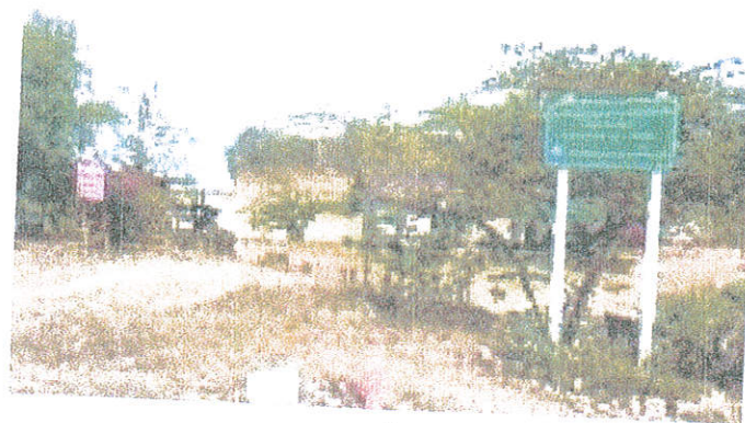
แผนที่ชุมชน